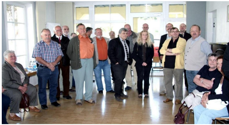
Teilnehmer beim Empfang